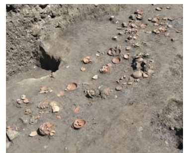
かわらけ溜り(北条高時邸跡)