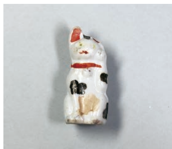
招き猫(北条高時邸跡)