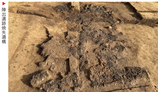
陣出遺跡焼失遺構

出土品たちはかつてここで暮らした人々の息遣いを伝えてくれます。みなさんも一緒に鎌倉の歴史に思いを馳せてみませんか。