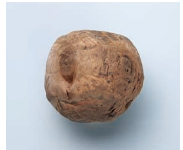
打毬の球(陣出遺跡)