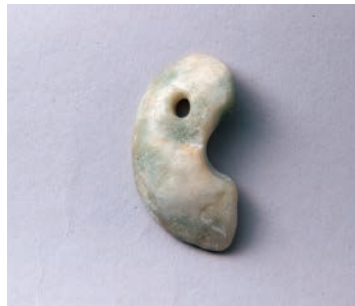
勾玉(块状耳飾りの転用品)(陣出遺跡)