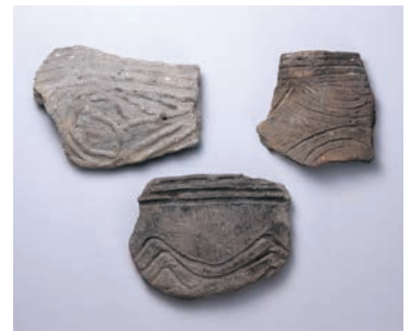
縄文土器(陣出遺跡)