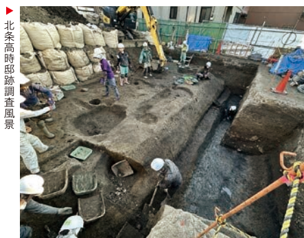
北条高時邸跡調査風景