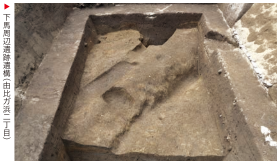
下馬周辺遺跡遺構(由比ガ浜二丁目)