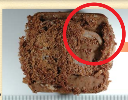
【チョコレート菓子に混入していた幼虫】