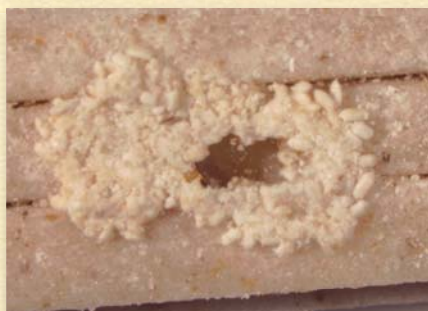
【ジンサンシバンムシの幼虫による食害(乾麺)】