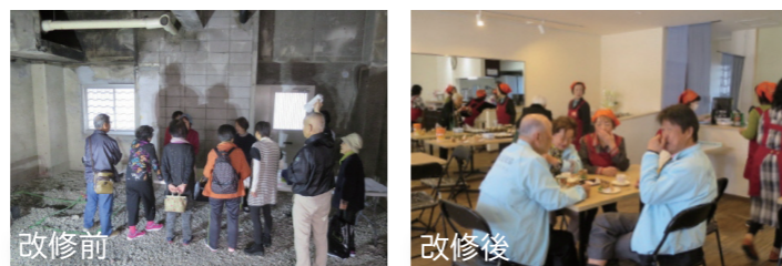
サロン ほっとサライ 改修費用: 約850万円

地域の自治会メンバーが中心となり、団地の空き店舗を改修し、多世代交流の場を整備しました。商店会、地域包括支援センター、小学校、大学など、多様なメンバーと連携しながら、活動しています。約30名のボランティアスタッフと定期ミーティングを実施しながら、ランチ・コーヒーの販売、憩いの場の提供等を行っています。改修にあたっては、バリアフリーにも配慮し、車いす対応トイレ等を整備してい