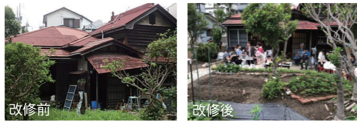
リトルファーム HOMMOKUもくり 改修費用: 約250万円

地域住民が主体となり、空き家(一戸建ての住宅)を地域交流拠点として改修しました。買い物が遠いなどの声に対応するため、買い物弱者支援も検討しています。庭は畑と花壇にし、ピザ窯も設置しました。畑で栽培した作物は、別の地域交流拠点で販売しています。