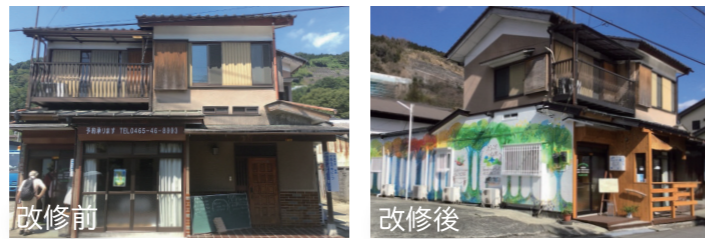
YAMAKITAぷらっと 改修費用: 約200万円

NPO法人が中心となり、空き店舗(店舗併用住宅)の一部を活用し、町内への移住の意向を持つ方々の相談や、移住者同士の交流を支援する拠点を整備しました。特産品の販売等も準備しており、町役場、町内会、商店街、地域に関心のある方々、専門家などと協力して取り組んでいます。