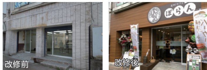
反町カフェぼらん 改修費用: 約1,000万円

誰でも参加できる居場所兼働き場の拡充をめざして、空き店舗(共同住宅1階)を改修し、カフェをオープンしました。カフェ事業、就労準備講座、介護予防デイサロンの3つを中心に活動しています。事業に際しては、自治会に加入し、地域包括支援センター、民生委員等と連携して進めています。