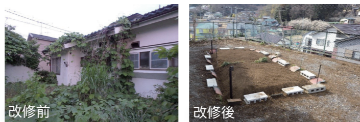
愛甲原住宅 改修費用: 約50万円

住宅地の端に位置する空き家の利活用事例です。立地上、活動拠点とするのは困難なことから、イベント広場・畑として使用可能なスペースを作り、バーベキューなど、定期的なイベント開催などを行っています。また、庭には畑を整備し、ジャガイモ等の栽培を行い子供達と収穫祭を楽しんでいます。