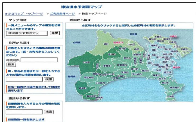
e-かなマップ画面(検索ページ)

防液堤高さや事業所構内に設置している防潮堤等の高さを考慮し、各施設設備の浸水レベルについて再度確認する。