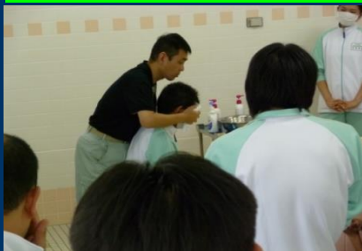
シャワー浴介助の指導員による実技指導場面。