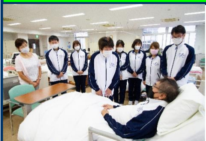
技能習得と就職への共有した目標はクラスの結束を高めています。