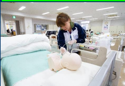
医療的ケアの実技も実施します。