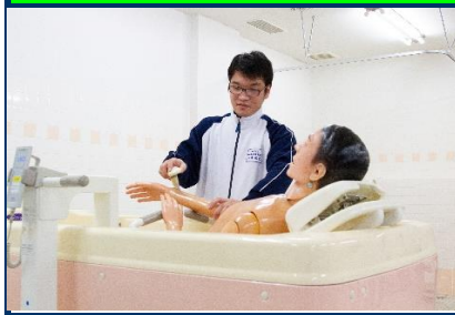
利用者の気持ちに寄り添う支援のあり方を習得します。