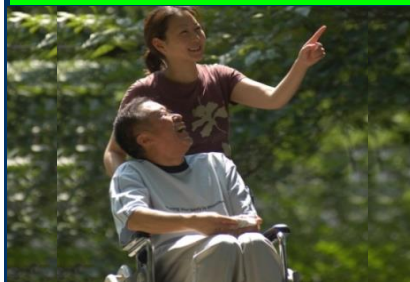
車椅子介助。利用者本位の介護のあり方も習得していきます。