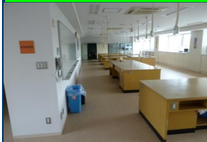
明るく清潔、開放感のある環境づくりに取り組んでいます。