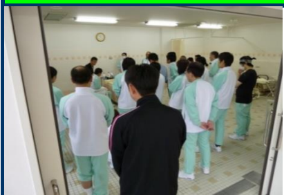
技術校生は技能習得と就職に向け、常に真剣に取り組んでいます。