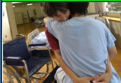
ベッドから車椅子への移乗介助。