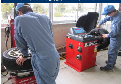
タイヤ交換機・バランサー