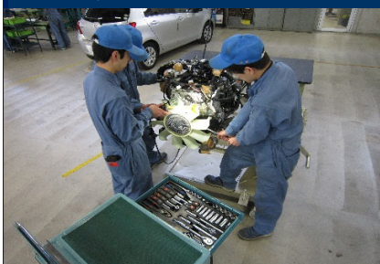
実習用教材エンジン