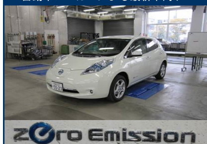
自動車メーカーによる最新車両デモ