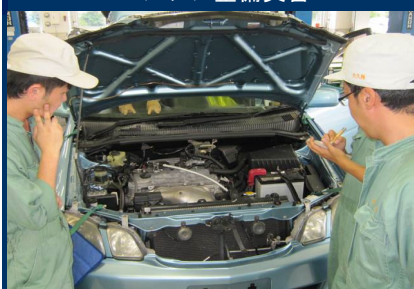
エンジン整備実習