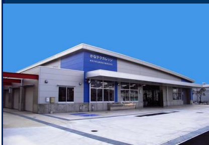
自動車整備実習場