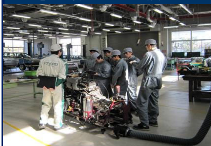
電子制御エンジン整備実習