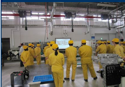
自動車整備実習風景