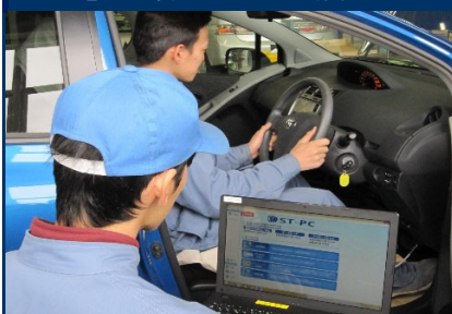
電子制御エンジン整備実習