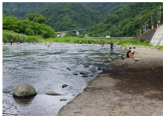
図2：相模川支流（中津川・馬渡橋付近）

最近、アユルアー釣りの人気上昇していますが、可能な区域が設けられており、多くの人が楽しんでいました。