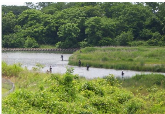
図1：相模川本流（昭和橋付近）

6月1日、県内の各河川（相模川、酒匂川、早川、多摩川）において、アユ釣りが解禁されました。多くの釣り人が訪れ、友釣りや毛ばりなどで釣果をあげていました。友釣りでする人は、多い人で40～50尾ほど釣りあげていました。