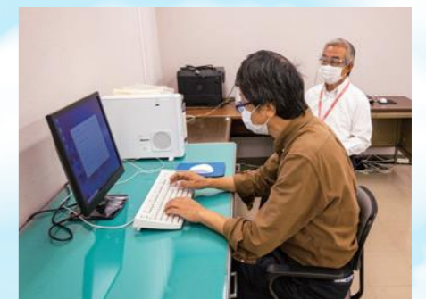
ワークサンプル作業検査（神奈川県版）、厚生労働省編一般職業適性検査、OA検査（幕張版）