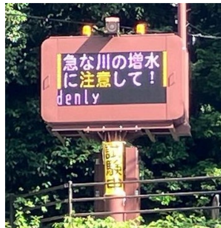
雨量情報表示盤の現地写真例