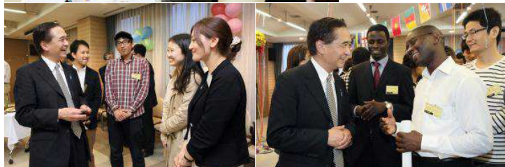
写真で見る「かながわ国際ファンクラブ」発足式の様子