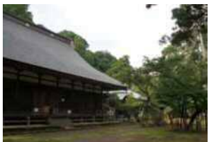
箱根湯本に建つ早雲寺は大永元(1521)年に氏綱によって創建された北条氏の菩提寺。秀吉の小田原攻めでは本陣が置かれた。北条五代の供養塔も。