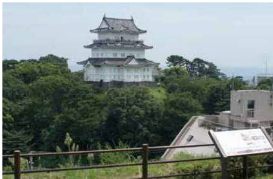
小田原城(天守閣の北西)。JR東海道線を挟んだ住所にある八幡山古郭東曲輪からの眺め。この辺りは北条氏の頃の城の中心地だったと考えられ、周辺からも数々の遺構が発掘されている。