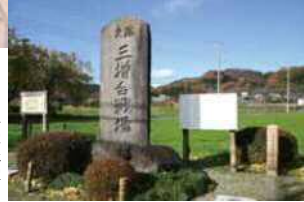
愛川町の三増合戦場碑が立つ広場では、慰霊のため毎年「三増合戦まつり」が10月の日曜日に開催されている。