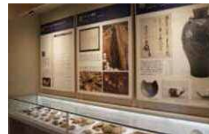
平成の大改修で天守閣内の展示も大幅リニューアル。5フロアある各階では、北条氏や小田原城に関する歴史を貴重な資料や映像などで学ぶことができる。

天守閣を囲む城内の常盤木門や銅門、馬出門なども昭和から平成にかけて復元・復興され、江戸時代に近世城郭として生まれ変わった小田原城を体感することができる。