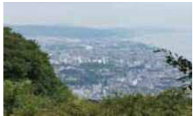
秀吉も見ていたであろう、一夜城からの眺め。この世の春を謳歌する天下人秀吉の姿が目に見え。周辺は国指定史跡、展望台なども整備。