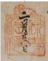
歴代当主が使用した虎を配した印判。印文の「禄壽應穩」には財産と生命が穩やかであるようにとの願いが込められているという。ほかにもいくつかの印判があった。