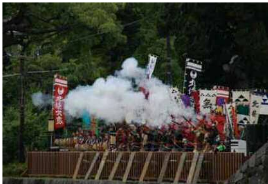
小田原で開催される数々のイベントの中でも最大規模を誇るのが「小田原北條五代祭り」。鉄砲隊や手づくり甲冑隊の武者隊による勇壮なパフォーマンスが北条五代の繁栄を讃える。