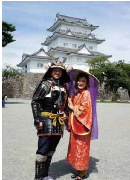
甲冑・兜を身に着け武将になったり、打掛や忍者などの衣装をまわったりする「コスプレ体験」はタイムスリップ気分が味わえる思い出。着替はスタッフが手伝ってくれる【時間】9:30~16:00(最終受付は15:30)【料金】一般300円(中学生以上)