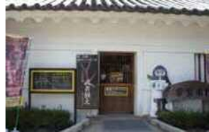
城址公園内の本丸広場、常盤木門の1階にある「甲冑・忍者の館!小田原城情報館」では甲冑や打掛、忍者衣装の貸出も行なっている。