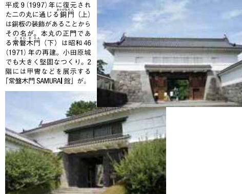
平成9(1997)年に復元された二の丸に通じる銅門(上)は銅板の装飾があることからその名が。本丸の正門(下)は昭和46(1971)年の再建。小田原城でも大きく堅固なつくり。2階には甲冑などを展示する「常盤木門SAMURAI館」が。

小田原城や小田原の歴史を「北条五代ゾーン」「江戸時代ゾーン」「小田原情報ゾーン」に分け、紙芝居や人形芝居、ジオラマや街並みのセットなどで楽しく学べる施設。近隣の観光名所の情報も入手できる【開館】9:00~17:00【入館料】一般300円(天守閣、常盤木門SAMURAI館との3館共通券は一般700円)