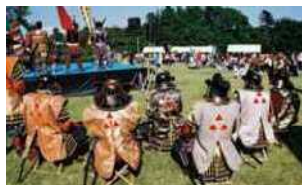
天下統一を目指し小田原を包囲した秀吉の戦いを記念した「一夜城まつり」。10月中旬の日曜日に石垣山一夜城歴史公園で開かれ様々な催しが行われる。

小田原ちようちん夏まつりは地元小学生がつくった約2000個の小田原ちようちんに明かりが灯され、ちようちん踊りなどで盛り上がる。7月下旬の土日開催。