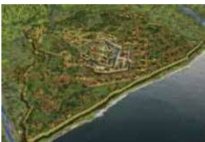
秀吉との戦いに備えて整備された総構。約9kmにわたり土塁と空堀で城を囲んだ。戦国時代最大の城郭であり、関東最大の街だった。(OG成瀬京司)