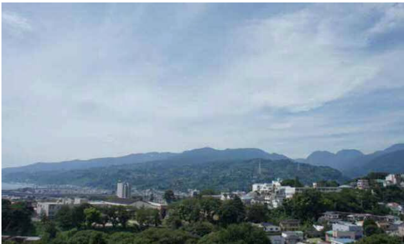
小田原城天守閣遺構からはまさに絶景が、北に丹沢の山並み、南に相模湾、東が小田原の市街地、西に箱根山や真鶴半島、伊豆半島を望む。秀吉が築いた石垣山も目の前 【入館料】一般500円【開館】9:00~17:00(入館は16:30まで)