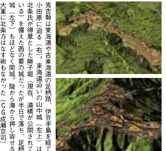
秀吉勢は東海道や古東海道の足柄路、伊豆半島を経て小田原に迫る(左)。東海道沿いの山中城(左上)は北条氏が得意とした障子堀。現在、遺構が公開されている。備え西の要の城だったが半日落ち。足柄城(右下)もほとんど開城。陸から海から押し寄せる大軍に北条方はなす術もなかった(CG 成瀬京司)