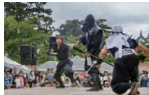
忍者の里「風魔まつり」では、手裏剣投げや吹き矢などの忍者体験が楽しめるブースも設置される。8月下旬の土日に小田原城址公園二の丸広場で開催。