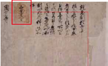
永禄4(1561)年に氏政が鎌倉円覚寺に出した朱印状。不法を行う者がいれば直ちに上告せよという内容。上杉謙信の小田原攻め前の緊迫した状況がうかがえる(神奈川県立歴史博物館蔵)