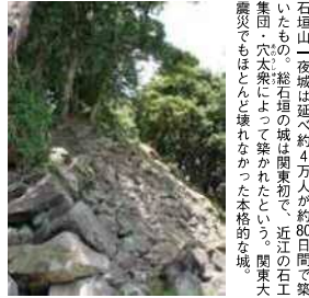
石垣山一夜城は延べ約4万人が約80日間で築いたもの。総石垣の城間東初で、近江の石工集団・穴太衆によって築かれたという。関東大震災でもほとんど壊れなかった本格的な城。

現在、公園として整備された石垣山城址を訪ねると、その本格的なつくりに驚かされる。眼下に広がる小田原の街を望みながら、北条五代に思いが馳せる。