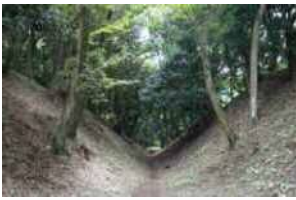
尾根に築かれた小田原城。江戸時代になると海側平野部に中心は移り尾根側の遺構が残った。小峯御鐘ノ台大堀切は深さ10mを超える全国最大級の空堀。

備中伊勢氏出身の早雲は幕府の奉行人だった。長享元(1487)年、今川氏の内紛を調停するため駿河に入り、その後、伊豆の堀越公方の子、足利茶々丸を追い出し伊豆国を押さえる。韮山城に拠った早雲は、次に