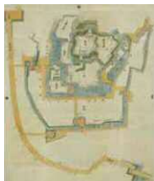
江戸時代後半に出された「日本古城絵図」に載る「相州小田原城図」。図の上方面で、東から西にかけて東海道も描かれ、街道に臨む城下町の様子がわかる。