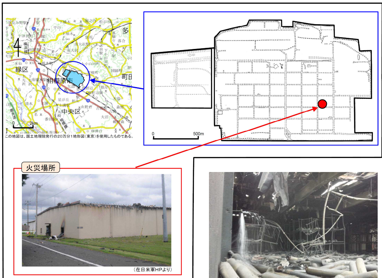
図1 相模総合補給廠の位置図

在日米陸軍相模総合補給廠内の倉庫（神奈川県相模原市） （鉄筋コンクリート造（一部鉄骨造）平屋建）