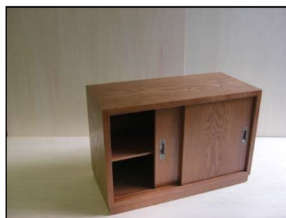
課題例 1(DVD ラック)