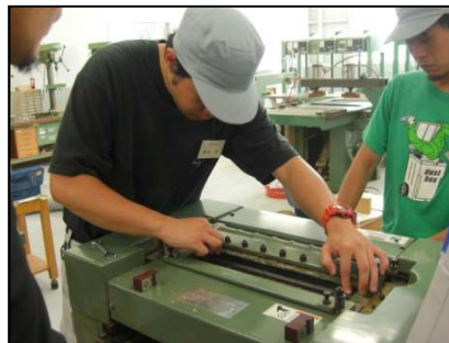
木工機械のメンテナンス