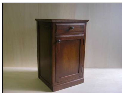
課題例 2(ベッドサイドボード)