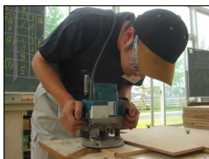
電動工具による加工