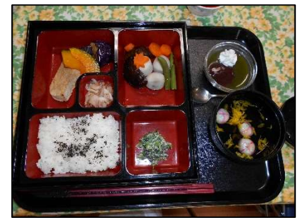
大量調理実習(常食、弁当形式)