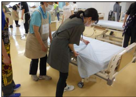
介護技術の基本 (ベッドメイキング)