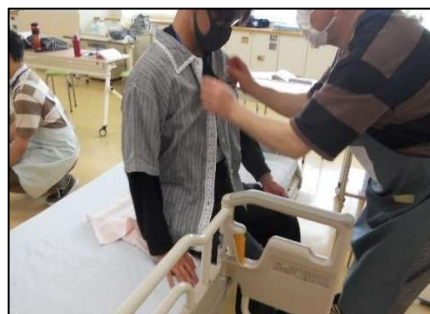
生活支援技術実技 (整容)