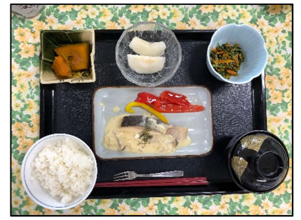
大量調理実習(常食、定食形式)