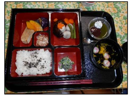
大量調理実習(常食、弁当形式)