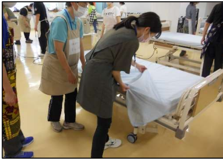
介護技術の基本（ベッドメイキング）