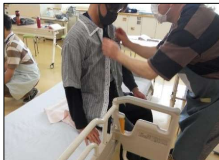
生活支援技術実技（整容）