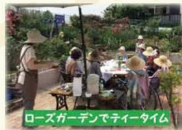
ローズガーデンでティータイム