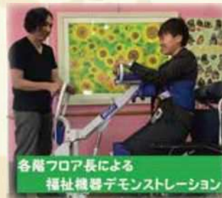
各階フロア長による 福祉機器デモンストレーション