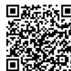
【かながわひきこもり 相談LINE】