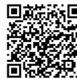
【かながわひきこもり 相談 LINE】