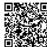
【かながわ子ども・若者 総合相談 LINE】