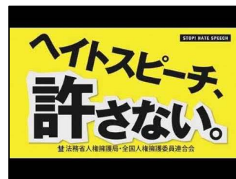
人権啓発スポット動画「ヘイトスピーチ、許さない」