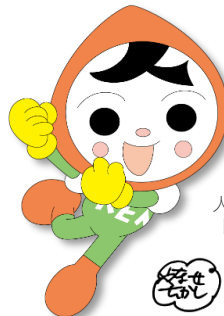
人権イメージキャラクター 「人KENまるる君」