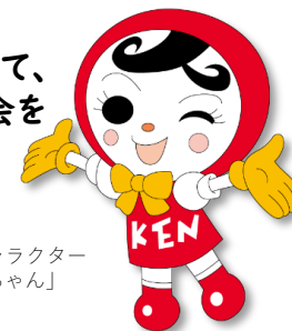
人権イメージキャラクター 「人KENあゆみちゃん」

国籍・文化・民族等の違いを越えて、 お互いの人権を大切にしよう社会を 共に築きましょう。