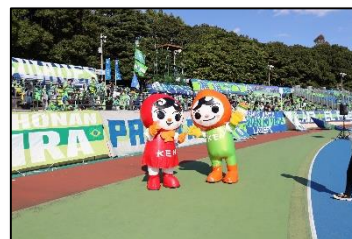
湘南ベルマーレホームゲーム開催時における啓発活動 (令和4年10月)