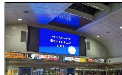
川崎駅街頭ビジョンにおける啓発活動 (令和4年1月)