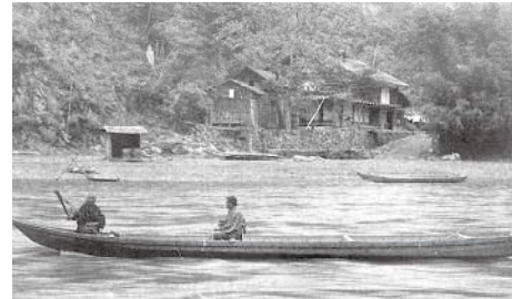
吉野反田前の渡し