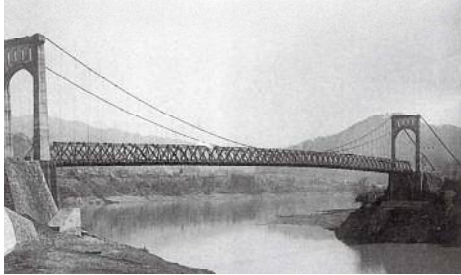
勝瀬橋 相模原市 (旧藤野町) 竜田～勝瀬坂 初代勝瀬橋