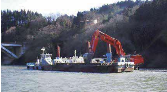
バックホウしゅんせつ船

昭和19年に湛水を開始して以来、半世紀以上を経過した相模貯水池では、ダム宿命である堆砂が進み、平成5年度から令和元年度まで、「相模貯水池大規模建設改良事業」として堆砂対策を進めてきました。令和2年度以降も引き続き堆砂対策を行う必要があるため、上流域の災害防止と有効貯水容量の維持を目的に、関係事業者