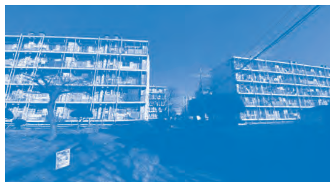
鉄筋コンクリート造の県営住宅