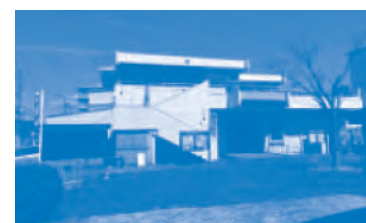
いちようショッピングセンター

県営いちよう下和田団地で子育て世帯向けに、和室を洋室に改修した住戸(入居期限付き※)を募集しています。ご応募お待ちしております。