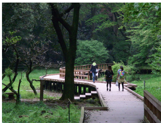
(原風景を想起させる湿性植物園)