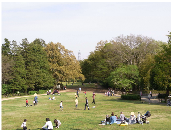
(集落跡にある古代芝生広場)

起伏に富んだ園内では、自然観察会や田植え・稲刈り体験などのイベントが催され、春秋を中心に多くの来園者に親しまれ、公園利用者によるボランティア活動も盛んに行われています。