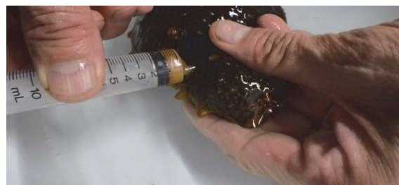
写真2 体壁の穴からシリンジで生殖腺（卵巣）を吸い出す