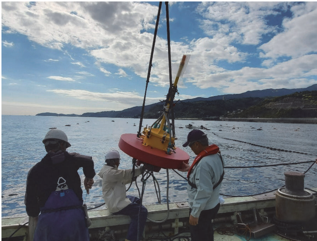
魚探ブイを漁船のクレーンで吊上げている様子

始まったばかりの試験なのでこれからの取り組みに期待ということになりますが、将来的にはどの現場でも役立つツールとなるよう、これからも漁業者と二人三脚で調査と分析を進めていきます。