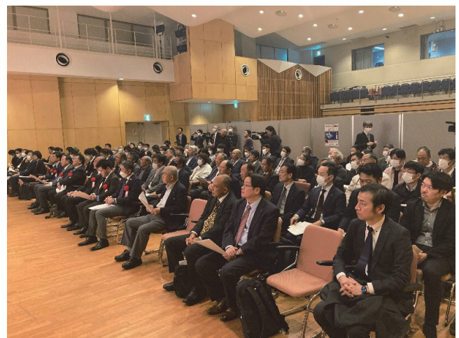
盛況だった会場の様子