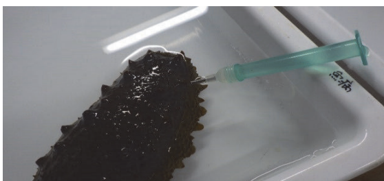
写真1 頭部の右体側に針で穴を開ける

そこで、シリンジを用いて生殖腺を取り出すことを試みたところ（写真1，2）、ナマコに内臓を吐出させるなどのデメリットはなく、短時間で簡便に成熟度を判別することができました。現在、当センターでは、この手法で効率よくナマコの成熟度調査を行っています。