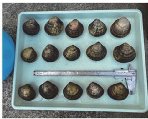
写真2 養殖したトリガイ（2023年5月）