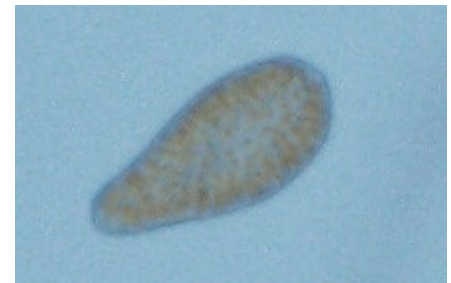
写真2. シャットネラ マリーナ ( Chattonella marina )