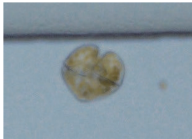
写真1. カレニア ミキモトイ ( Karenia mikimotoi )

今後も、漁業者が安心して漁業に取り組めるよう、海や魚介類の異変に関する情報提供や依頼に迅速かつ適切に対応してまいります。