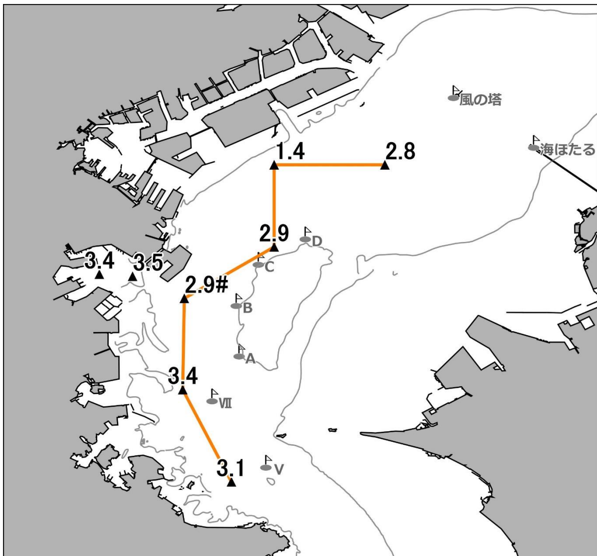
底層の溶存酸素量(ml/L)

発行 神奈川県水産技術センター 企画資源部 海洋資源担当 電話 046(882)2313