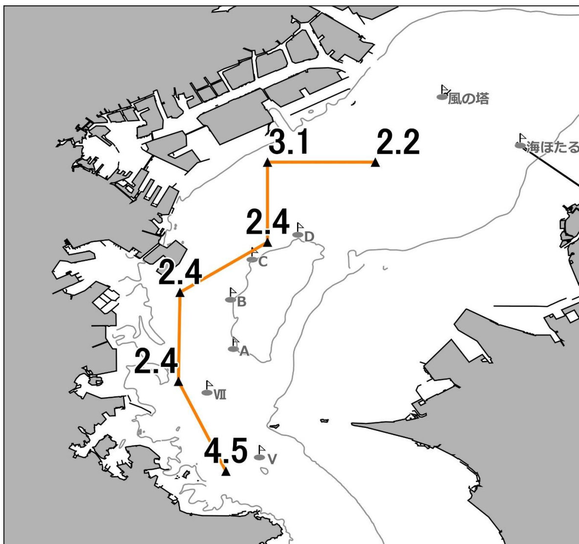
底層の溶存酸素量(ml/L)

発行 神奈川県水産技術センター 企画資源部 海洋資源担当 電話 046(882)2313