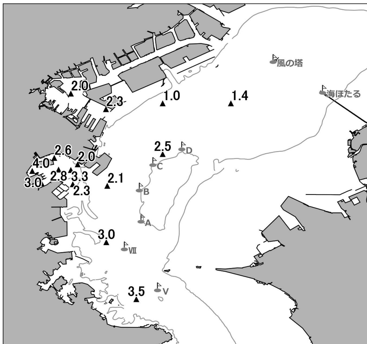
底層の溶存酸素量(ml/L)

発行 神奈川県水産技術センター 企画資源部 海洋資源担当 電話 046(882)2313