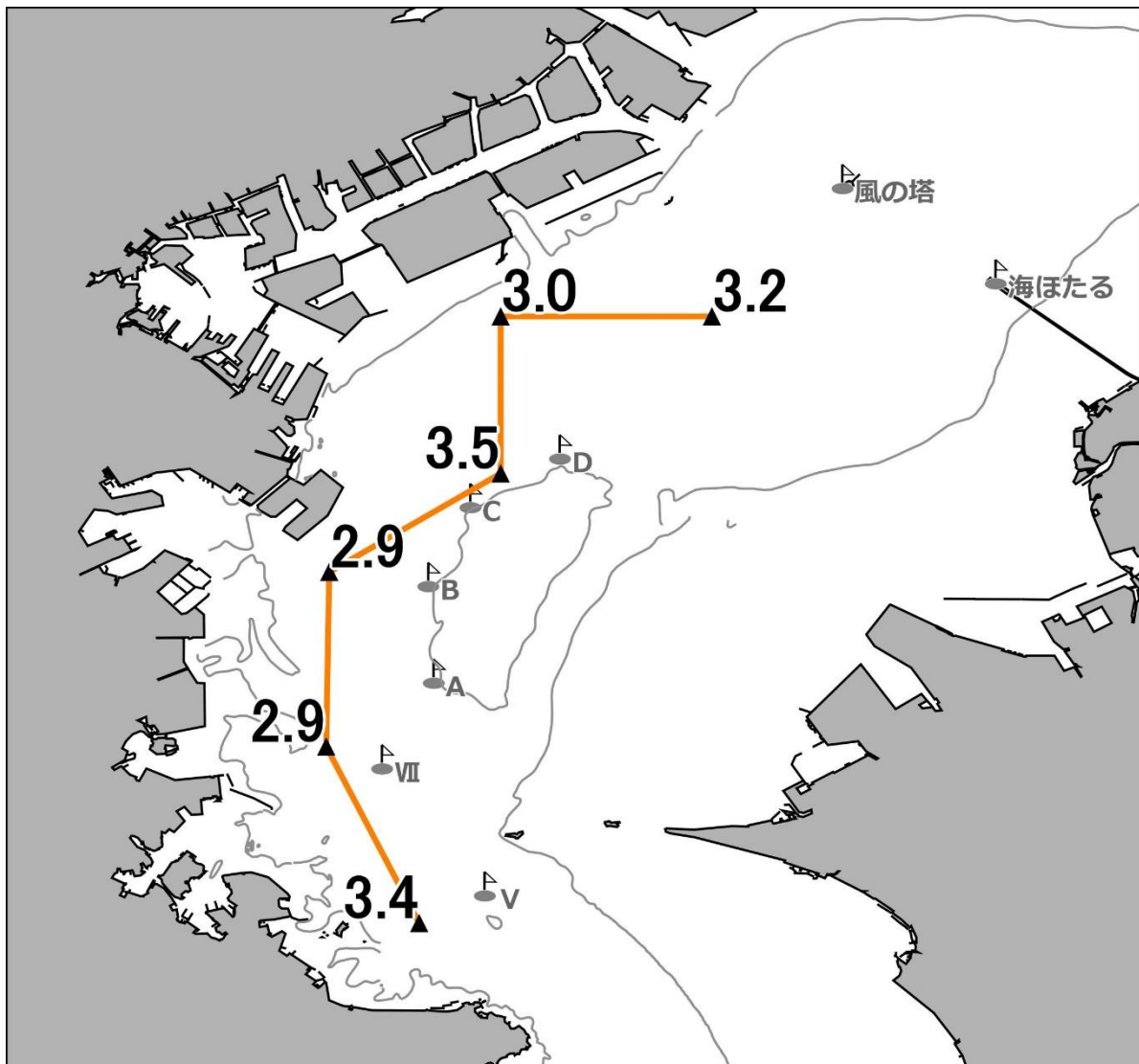
底層の溶存酸素量(ml/L)

発行 神奈川県水産技術センター 企画資源部 海洋資源担当 電話 046(882)2313