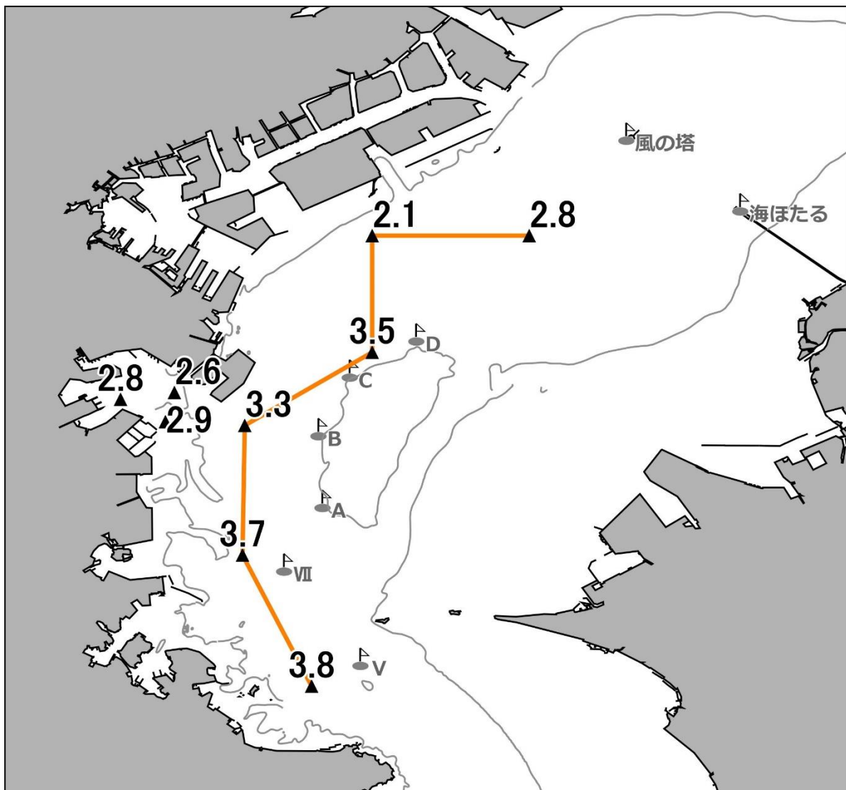
図. 底層の溶存酸素量(ml/L)

前回 (8/26～8/27) の観測時に広範囲で確認された貧酸素水塊の中層化は今回確認されませんでした。