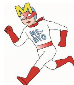
未病改善ヒーロー ミビョーマン