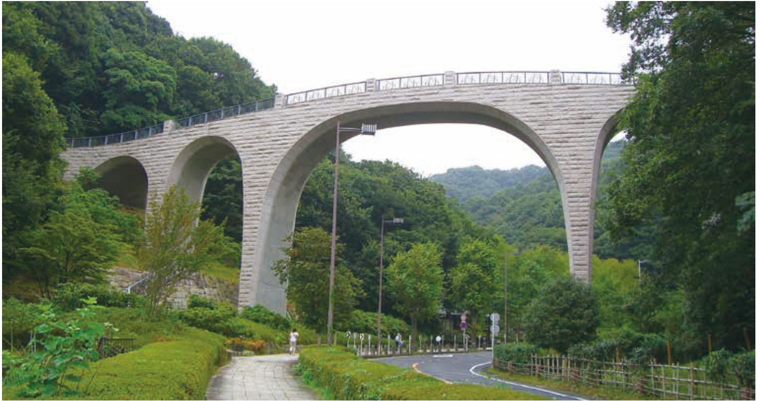
公園のシンボル 森のかけはし

厚木市西部に位置する全体が森林に覆われた広大な公園です。宅地開発に伴い保全された緑地を、公園として整備しました。園内には、バーベキュー場、アスレチック広場、森の民話館、森のアトリエなどの施設があり、森林浴プラスアルファの様々な活動を楽しむことができます。