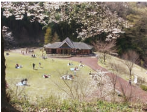
陶芸や木工などが体験できる森のアトリエ