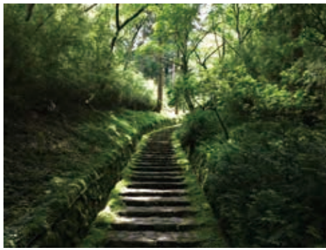
離宮時代を偲ばせる二百階段