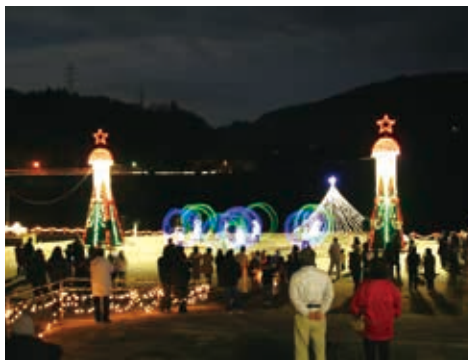
澄んだ夜空にきらめく灯り （相模湖やまなみイルミネーション（12月））