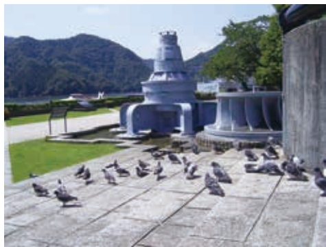
水力発電の歴史を伝える発電機モニュメント