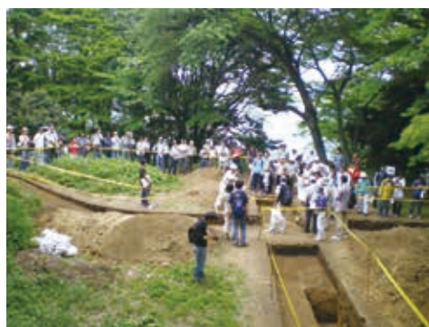
津久井城発掘調査見学会