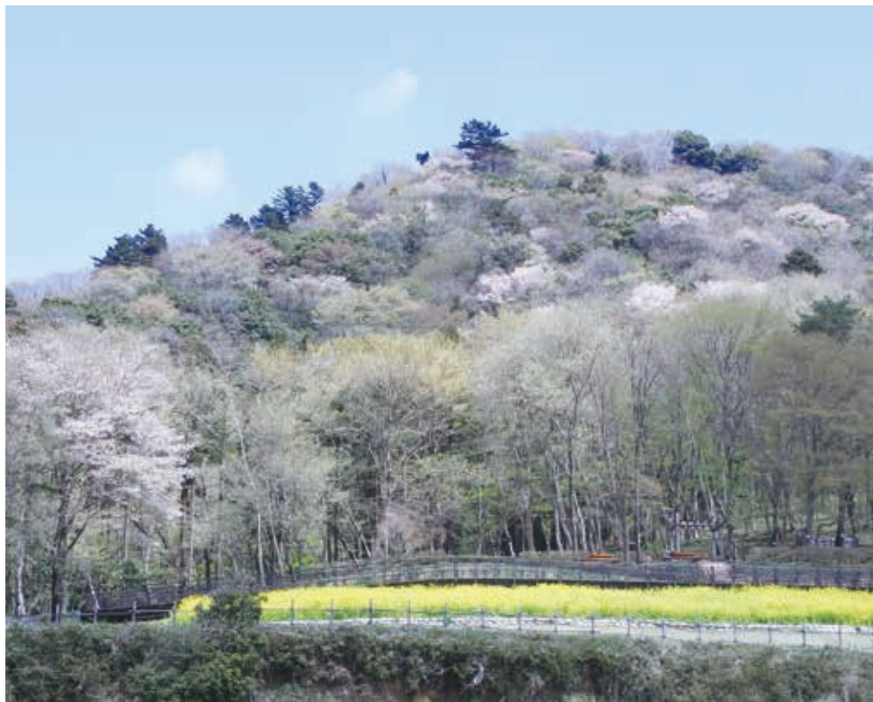
山桜で色づく春の城山

津久井湖畔にそびえる城山は県下最大級の中世の山城です。この城山を中心とする広大な敷地に「水の苑地」「花の苑地」「根小屋地区」などが開園しています。根小屋には江戸時代に代官所が置かれ、城山は幕府の御林として厳重に管理されていたことから、歴史と里山の自然が色濃く残されています。この公園では、地域の人たちと共に地域の文化的資源や自然資源の活用と保全への取り組みを進めています。