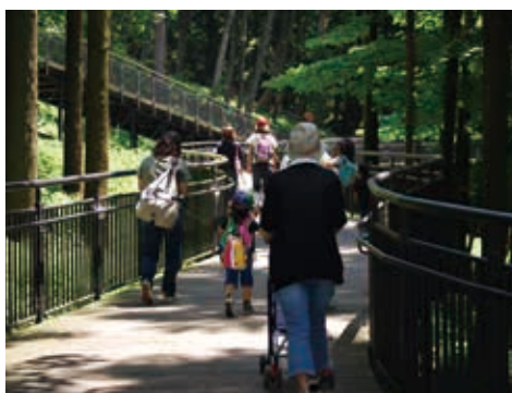
森の中を散策できるバリアフリー園路