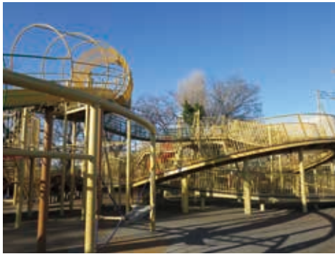
子供に人気の大型遊具