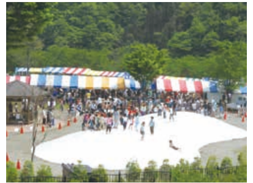
子供広場のふわふわドーム