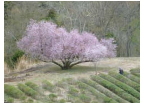
茶畑とマメザクラ