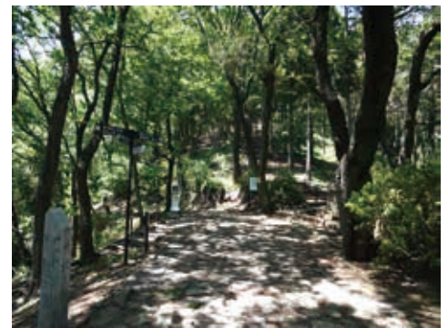
白山巡礼峠ハイキングコースともつながる