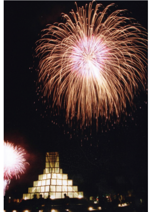
湖面に響く大迫力の音と振動 （さがみ湖湖上祭（8月））