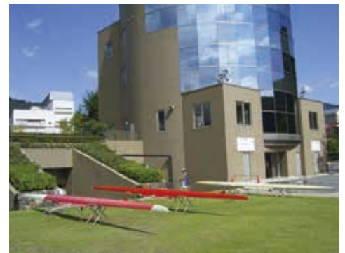
カヌーの手入れがされる艇の広場