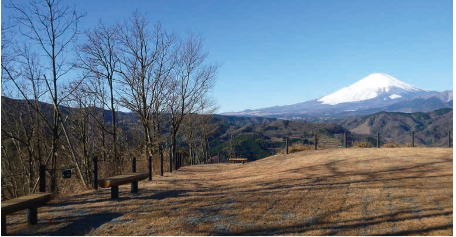
さくら山展望広場からの富士山

つつじ山展望広場は、戦国時代に「鐘ヶ塚砦跡」があったとされ、県指定史跡河村城跡を眼下に見ることができます。