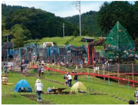
遊具がある冒険の森