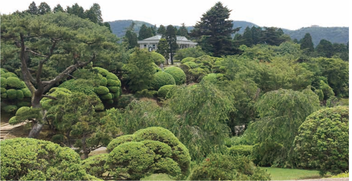
弁天の鼻展望台から見た庭園美

箱根の芦ノ湖南部に位置する離宮跡地につくられた公園です。明治時代に造営され震災により建築物が倒壊した箱根離宮は、戦後県に下賜され、公園として整備されました。園内には、離宮のデザインを模した湖畔展望館と、手入れされた由緒ある樹木が離宮時代の雰囲気を醸し出しています。