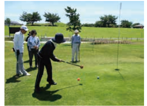
パークゴルフ場を備えたスポーツ広場