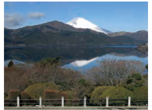
芦ノ湖と富士・箱根連山の見事な眺望