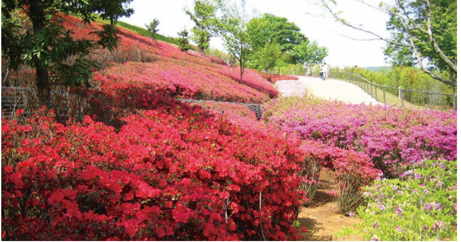
春のツツジ (花の斜面)

宮ヶ瀬ダムの直下にある樹林地を利用した広い公園です。ダム建設の施設跡地などを公園として整備しました。園内には40種類約4万本のツツジが植えられ、アスレチック遊具やふわふわドーム、ジャブジャブ池や工芸工房村、愛川町郷土資料館などの施設があり、ダム周辺の観光地として人気があります。