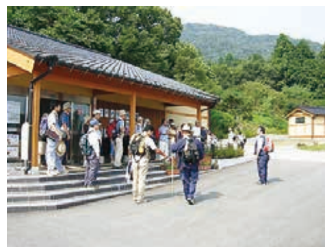
公園の玄関口、パークセンター