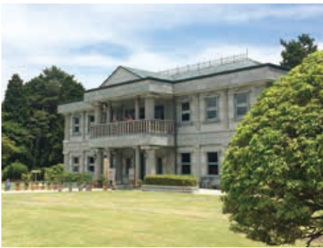
2階からの展望が素晴らしい湖畔展望館