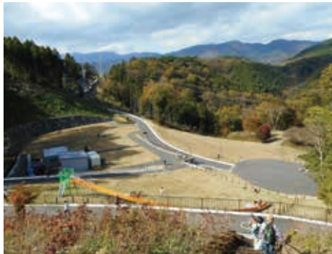
つつじ山展望広場から公園中心部