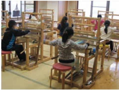
工芸工房村での機織り体験