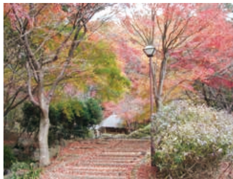
もみじで色づく民話館近くのあずまや