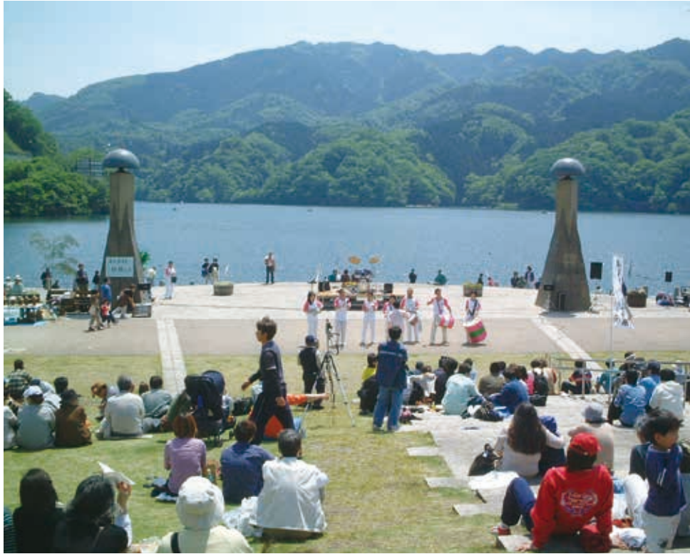
一年を通じた湖畔のイベント（相模湖やまなみ祭（4月））

1938年、相模ダムの工事用地を利用して公園に整備され、1964年の東京オリンピックではカヌー競技場となりました。その後1998年の「かながわ・ゆめ国体」の開催をきっかけに、現在の形に再整備されました。開放感あふれる湖面とそれを取り巻く山々の緑を背景に、観光による地域活性化の拠点となっています。