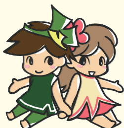
神奈川県自殺対策キャラクター いちょうくんやまゆりちゃん