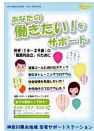
(県央地域若者サポートステーション)