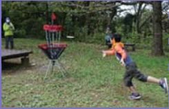
●ディスクゴルフの様子

3密状態になることを避けるため、子ども達の集合時間に時差を設け、各自受付を済ませたのちにディスクゴルフとネイチャーゲームに分かれました。ディスクゴルフは、自作したディスクを赤、青、黄色それぞれのキャッチャーに目掛けて投げ、チーム毎の投数を競いました。また、ネイチャーゲームでは、鎌倉中央公園の地図と磁石を片手に、トレジャーカードに記された6つのミッションのクリアを目指し、ミッション達成の充足感をチームで味わっていました。持参したお弁当を食べたのち、ディスクゴルフ班とネイチャーゲーム班を入れ替えて楽しみました。