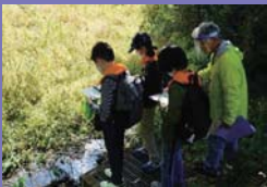
●ネイチャーゲームの様子

鎌倉市青少年指導員連絡協議会として、新型コロナウイルス感染拡大の影響で自粛による制限を受けている子ども達に、自然の中で身体を動かすことのできる機会を提供すべく「え？キャンプに行かないの？」を企画しました。