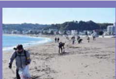
●実践型研修会の様子

近年はコロナ禍で開催を順延していましたが、今期は令和3年12月に三浦海岸でゴミ拾いを行いました。快晴に恵まれた冬の海岸は、一見きれいな見えたが、指導員39名による2時間程の活動後には、57kgのゴミが集まり驚きました。なかでも海洋汚染で問題になっているプラスチック類が多く、小さく形を変えてマイクロプラスチックとして砂浜に混じっています。また、たばこのフィルターは、分解されずそのまま残っており、空き缶は埋められている有様です。一人ひとりの何気ない自然への甘えは、大きな環境破壊につながることでしょ。青少年指導員として活動することで、様々な気づきが得られます。体験を通して地域にフィードバックすることで、個人レベルからの意識改革に少しでも貢献できるようにこれからも取り組んでいきます。