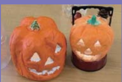
●完成したランタン