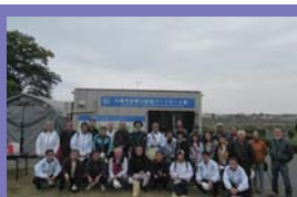
●プレー終了後の集合写真

コロナ禍での大変だったこと…「 活動の場が減り指導員同士で会うことが難しくなったこと 」