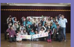
●「ジュニアフェスティバルあいかわこどものまち」の様子

6月の青少年健全育成者研修会では、青少年育成に関わる方々とともに、3部入れ替え制で、①アイスブレイキング&ネイチャーゲーム、②バルーンアート、③火おこしを学びました。地域の活動で生かせる指導技術の向上を図るとともに、横のつながり確かめることができました。