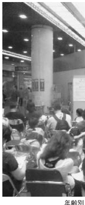
年齢別レーティング制度についてのミニ講座