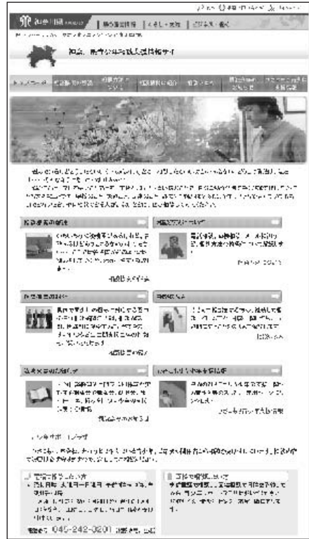
神奈川県青少年相談支援情報サイト