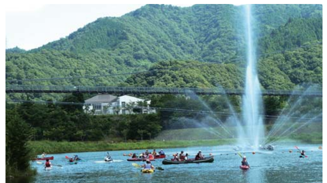
【チャレンジ・親子カヌー体験】

これからもジュニア・リーダーのP(企画)D(実行)C(振り返り)A(次の活動へ)をバックアップしていきます。