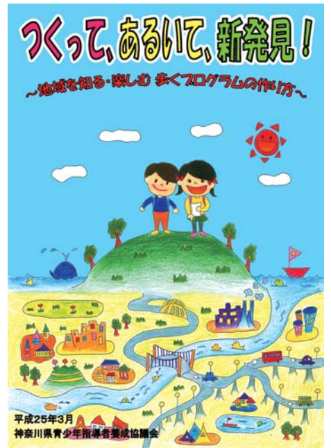
表紙 カラー 本文 モノクロ A4版 78P 対象 小学校高学年～