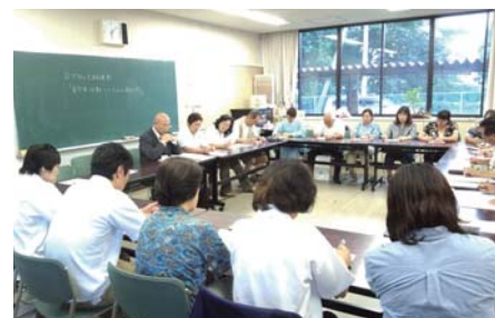
ブロック研修の様子

これからの活動の中で、今回学んだ事を生かしながら、子どもたちと「元気に・明るく・楽しく」をモットーに笑顔で活動して行きたいと思います。