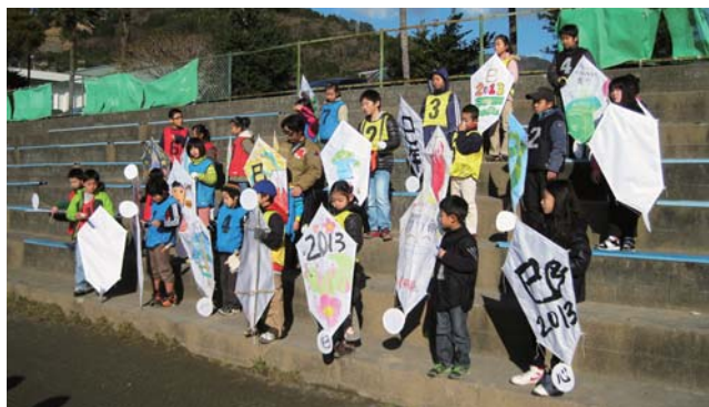
【平成25年 新春たこあげ大会】

湯河原町青少年指導員会では先人の知恵を子どもたちに伝え、未来を担う子どもたちに託していけるように、さらに努力し、頑張っていきたいと思います。