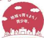
神奈川県青少年指導員