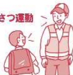
地域見守りパトロール