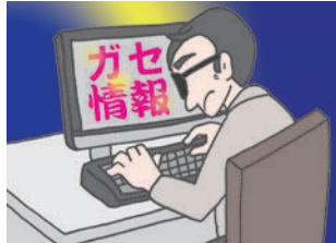
詐欺・風評被害 虚偽情報

インターネット上には、信用できる情報と、そうでない情報が混在しており、結果的に詐欺やニセ情報に翻弄される危険性があります。(信ぴょう性)