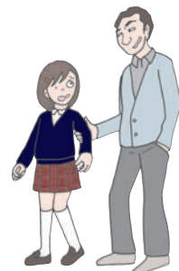
未成年者誘拐被害 ストーカー被害

不特定多数の人に見られる可能性があり、悪意を持った人に利用されてしまう危険性があります。 (公開性・公共性)