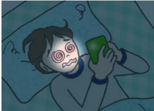
インターネット依存 ゲーム依存・高額請求

情報や娯楽を際限なく追い求めることで、日常生活や勉強がおろそかになったり、オンラインゲームの課金をやめられなくなる危険性があります。 (依存性)