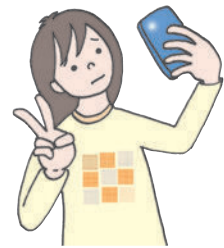
自撮り被害 誹謗中傷

インターネットや SNS に投稿した情報は拡散されやすく、自分ではコントロールができなくなる危険性があります。 (拡散性・記録性)