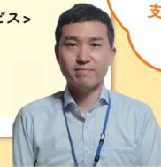
湘南東部総合病院 若年性認知症支援 コーディネーター