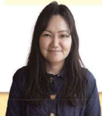
曾我病院 若年性認知症支援 コーディネーター