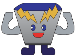
県営電気事業キャラクター ダムエレキくん