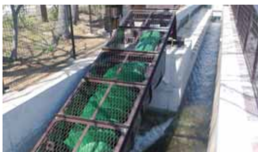
開成町あじさい公園発電所

平成26年度は開成町からの要請を受けて「開成町あじさい公園発電所」を整備しました。