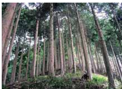
水源かん養林(相模原市緑区青根)