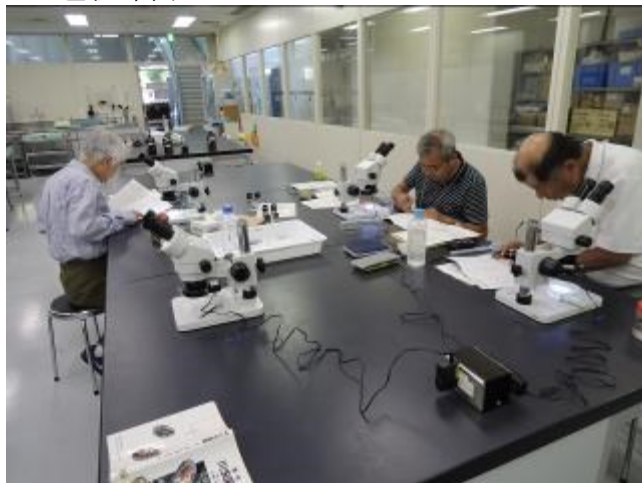
水生生物の同定法を学ぶ