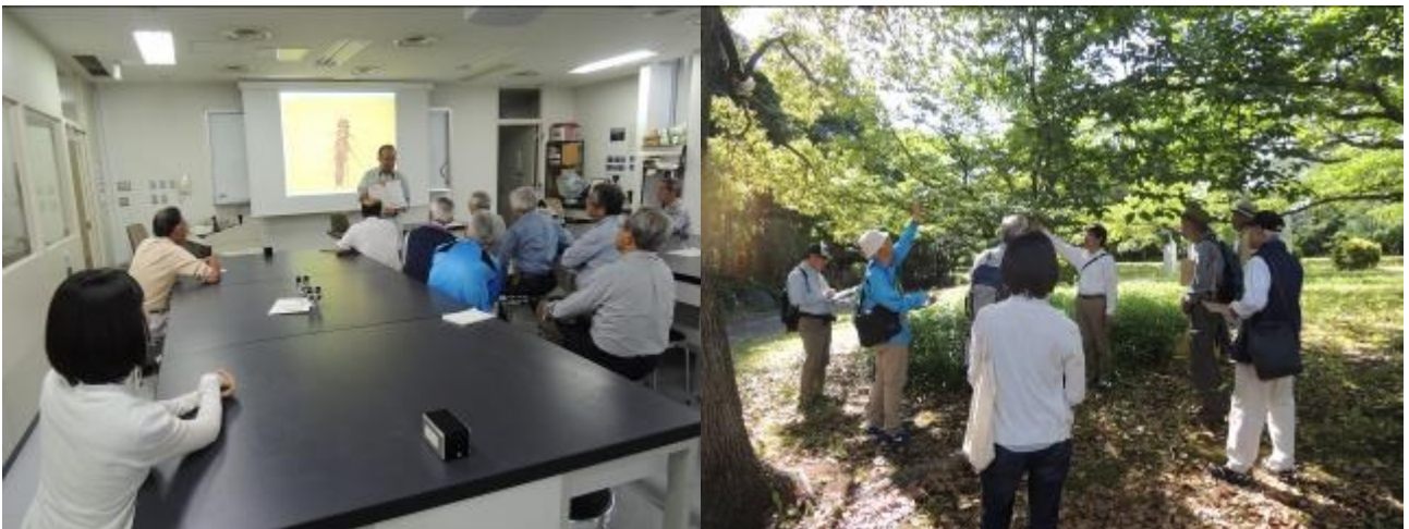
田んぼなど水辺生態系保全 《講義と実習》