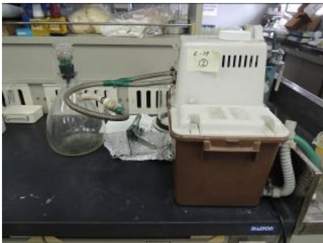
公定法及び簡易測定法による測定《実習》