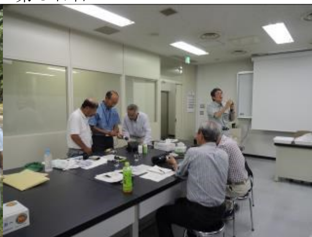
簡易測定について《講義と実習》