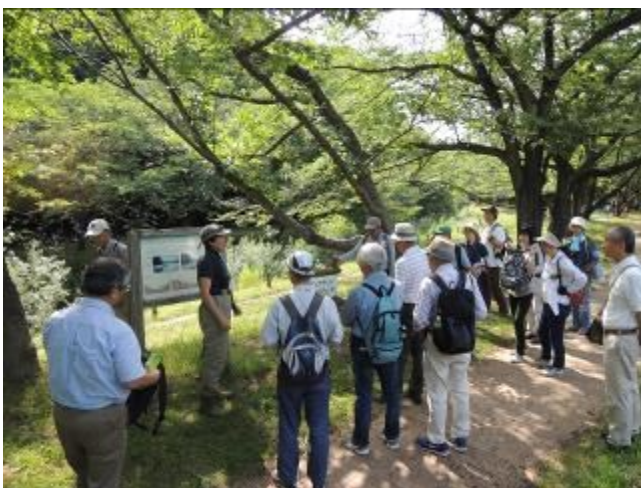
現地見学《大和市泉の森》 しらかしのいえボランティア協議会会員他