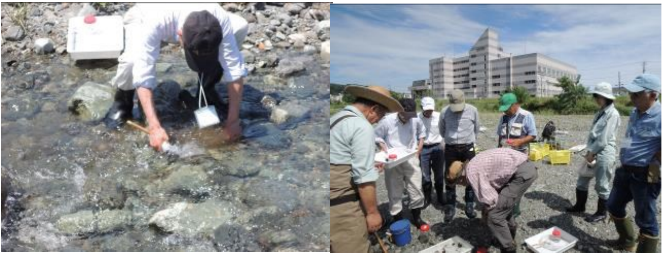
川音川（酒匂川合流前）《実習》