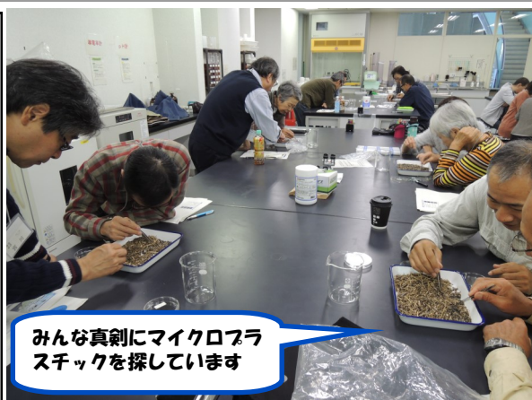
みんな真剣にマイクロプラスチックを探しています

受講生の感想：身近な相模湾におけるマイクロプラスチックについて知ることができた。まだ調査が始まったばかり、継続的な研究を期待します。調査に協力していきたい。マイクロプラスチックの最新の概要がわかり良かったです。特に県内の様子が参考になりました。実習も楽しかったです