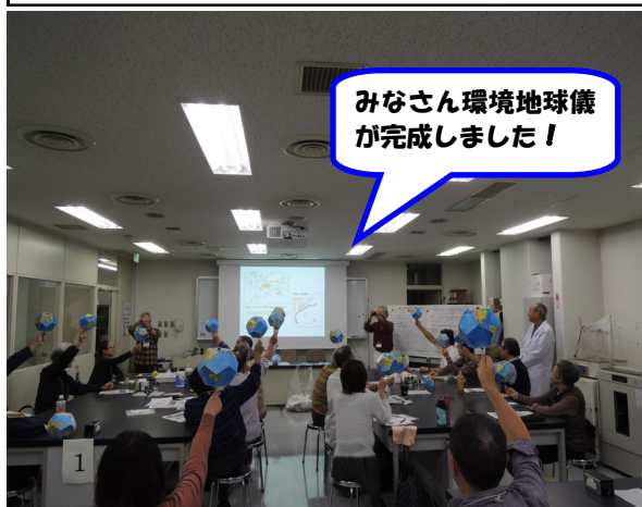
みなさん環境地球儀が完成しました！