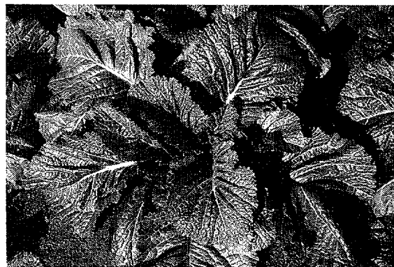
‘大山そだち’ (1995年12月1日撮影)

数は約3枚少ないが、1株重が30g程度大きく収量が高い。‘大山そだち’の葉の大きさ、葉色及び葉形は‘大山菜’に類似しているが、葉柄の長さ、葉柄・中肋基部の幅、葉柄・中肋の厚さが異なる。草姿は‘大山菜’に比べてやや立性で、収穫しやすい。耐寒性は‘大山菜’に比べて強く、葉面のアントシアニンの着色が少なく、枯葉の発生が少ない。抽台性は‘大山菜’と同程度で、抽台開始時期は9月中旬まきで3月中旬頃である。食味は、‘大山菜’に比べて辛味については同程度であるが、苦みが少なく、歯触りが柔らかく、食味の総合評価が高い。