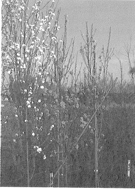
第1図 '照手桃' の開花状況