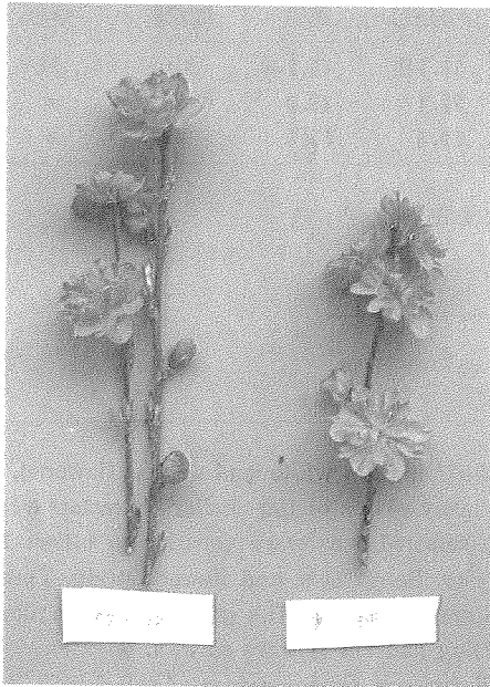
第3図 '照手紅' と対照品種 '寒緋' の花色