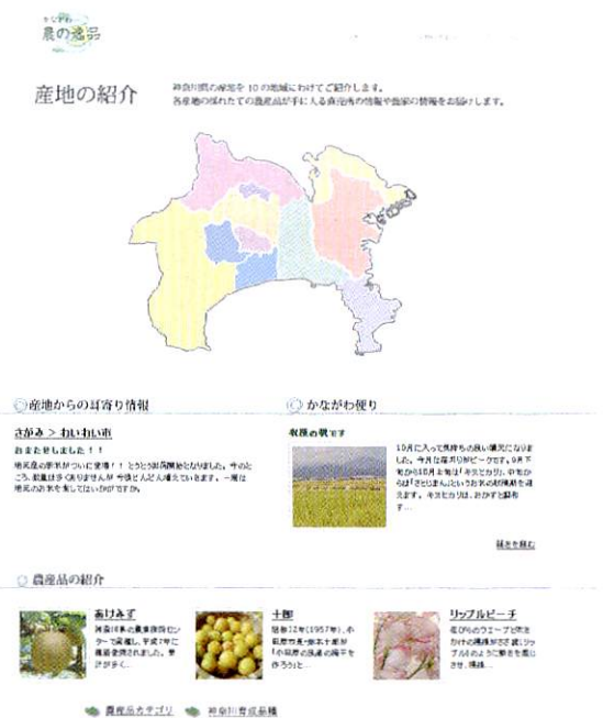
図2 かながわ農の逸品のTOPページ