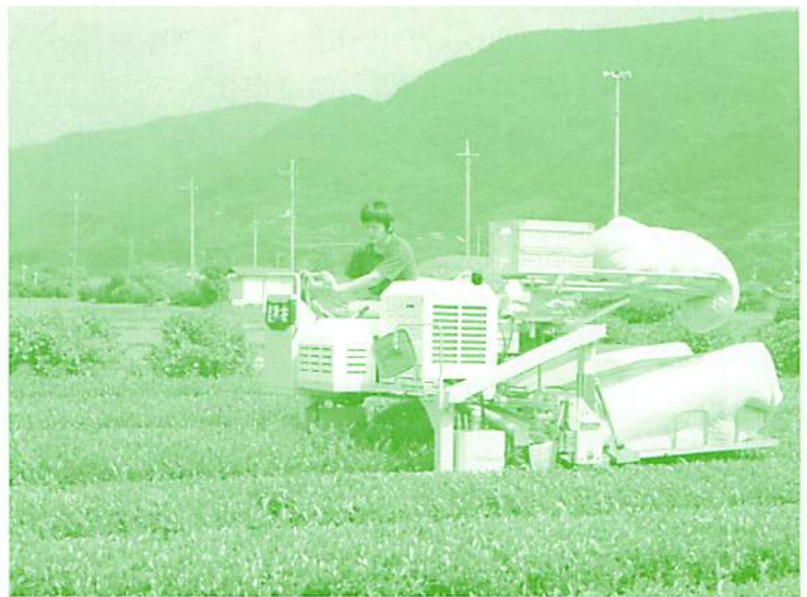
開成町での一番茶摘採

足柄地区事務所では、この三地域で座談会による産地形成や栽培講習会による栽培技術指導等に取り組んでおり、新しい茶産地として順調に発展してきています。茶樹の生育も順調で、開成町と愛川町では今年植栽4年目で、最初の一歩茶の摘採を迎えることができました。計画通り乗用型摘採機を使用し、摘採時間は30分/10a程度と可搬型摘採機と比べ非常に効率よく摘採されました。