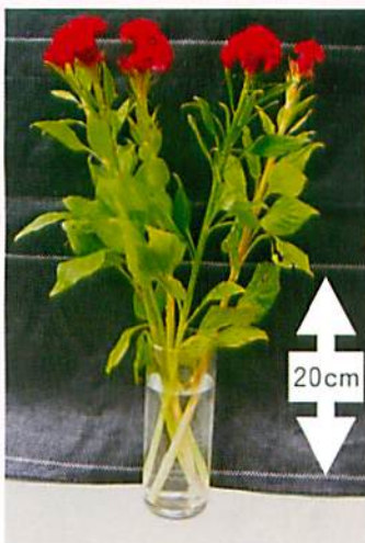
育苗箱栽培のケイトウ

当センターでは、今までよりも切り花をコンパクトでかわいい姿に仕立てる「育苗箱栽培」の検討を行ないました。