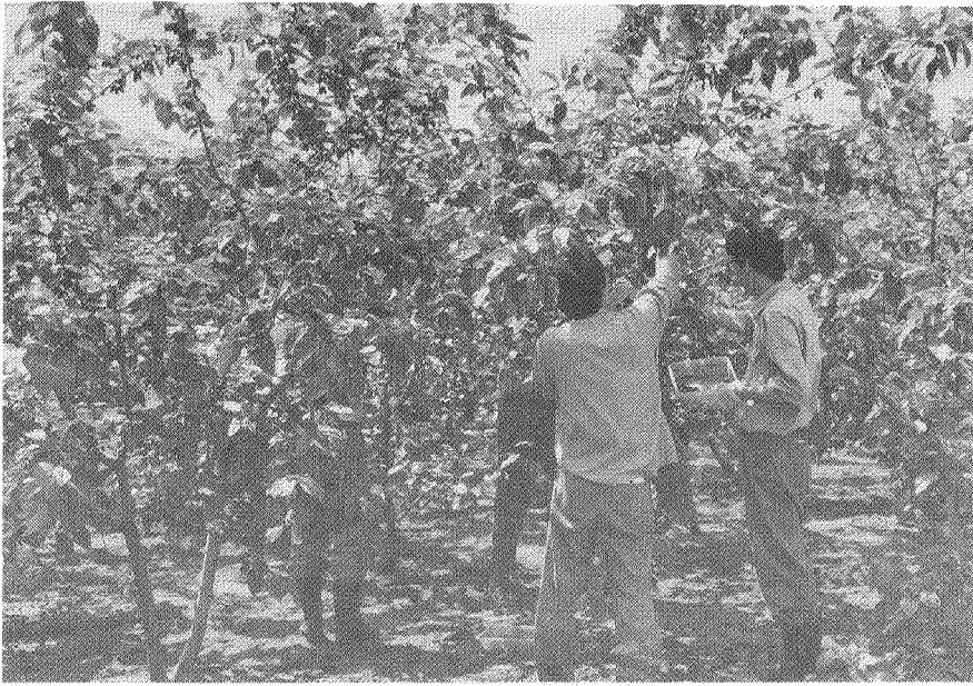
第4図 トルコフルーツ桑園