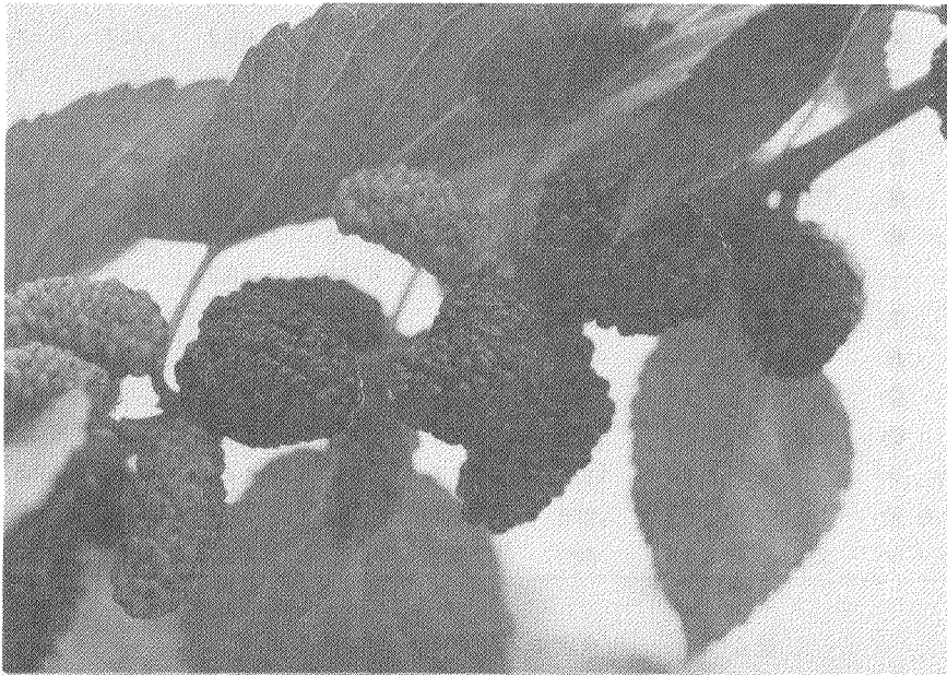
第2図 トルコフルーツ果実

以上のことより、桑の実と桑葉が多収であり、安定した増殖率を示したトルコフルーツが目的にかなった品種に近いと思われた。しかし、この品種の桑の実果汁糖度と酸度は他品種に比べると若干低く、また官能調査の総合評価も低かったことより、そのまま生食用として利用するには向かないと思われた。新鮮なものを直接消費に向けるのが最も有効な利用形態ではあるが、適切に加工を施した果実は生鮮果実に優るとも劣らない食品の価値があると考えられる。さらに、桑の実の保存性は極端に悪く、5℃で冷蔵しても一週間程度でカビが発生し、生食とするのなら確固とした流通経路が必要となる。しかし、桑の実を加工食品の原料とするのなら、生で流通することは少なく、直ちに加工処理するか冷凍保存すればよい。また、桑の実の風味も重要であるが、ジャムやワイン等に加工するには、少なからず補糖や補酸が必要となる。そこで、このような加工向けの品種としてトルコフルーツは十分利用に耐える品種であると考えられ、以下の試験に供した。