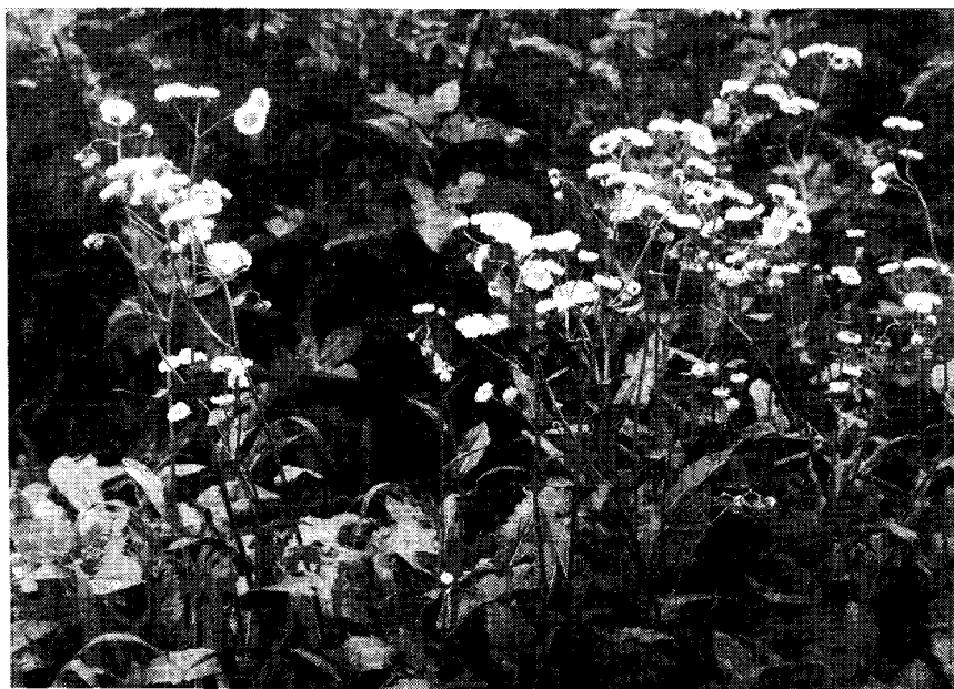
第2図 桑園の畦間に群生しているハルジオン

セイヨウタンポポ、イヌガラシ、オオアレチノギク、ホトケノザの各草種は、今回の試験で、パラコート系除草剤にかなり抵抗性のあることが認められた。しかし、そのほかに農家桑園では、オニタビラコ・タデ類・スベリヒユ・クワワサ・チチコグサモドキ・ウリクサ・コニシキソウ等も、パラコート系剤では枯殺しにくい草種として観察されている。これら広葉雑草の防除については、ハルジオンの防除方法と同様に、パラコート系以外の有効除草剤の選択及び同一除草剤の連用を避ける等の対策が肝要であろう。