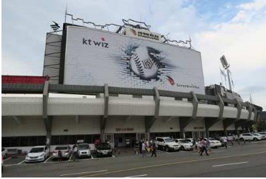
ktウィズパーク外観